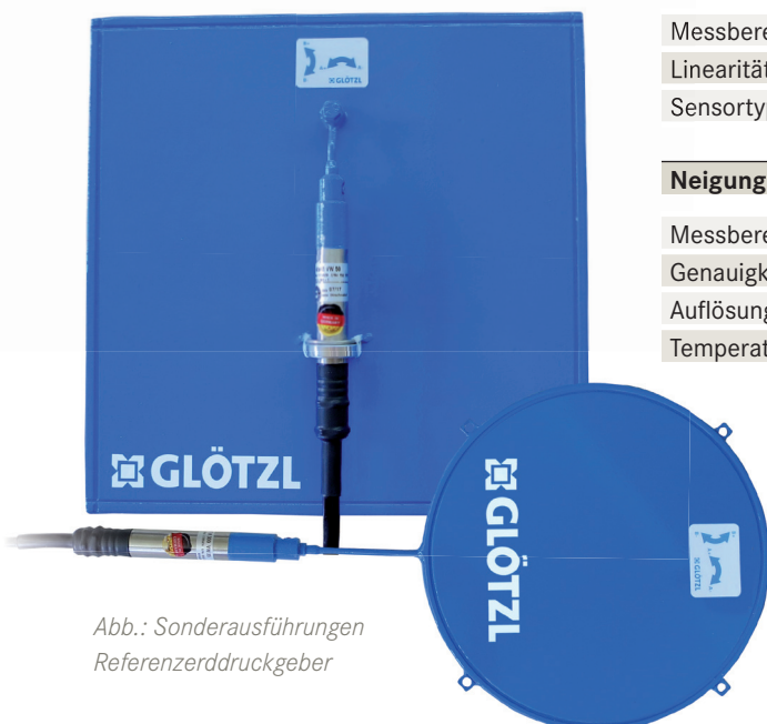
Abb.: Sonderausführungen Referenzerdrukgeber